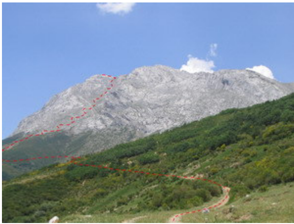
Vista general de la ruta