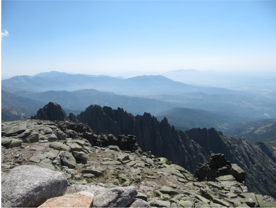
Los Galayos, paraíso de escaladores

fuelle. Un nuevo giro a la derecha nos lleva a la Mira ( 2343 metros) en cuya cumbre se conserva el torreón de un telégrafo óptico . Grandes vistas a todas partes