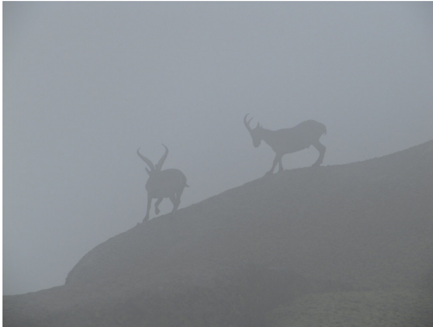
Machos cabríos entre la niebla

Continuamos hacia la cuerda para alcanzar los Campanarios, una sucesión de tres pequeños picos, en cuya cuerda hay vistas tanto a la zona castellana como a Cáceres. con suerte, veremos, entre el omnipresente piorno, las primeras cabras hispánicas