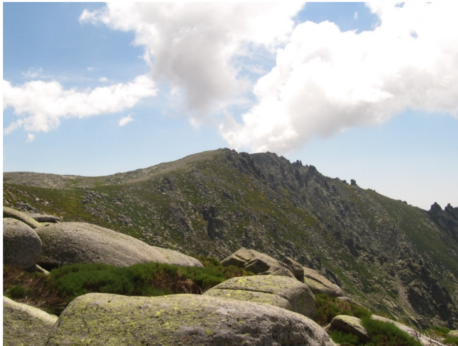
La Mira vista desde risco Piluca

Después de los Campanarios la senda nos lleva a la zona de los Pelaos tras, base de la Mira, donde se observan los restos de un refugio (observad la foto), y donde hay una