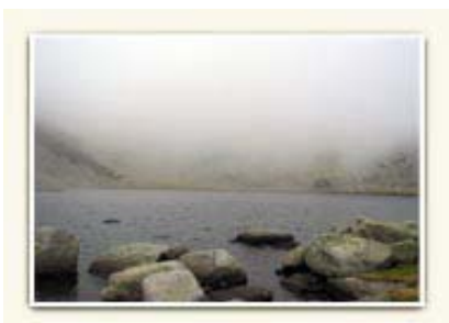
Laguna de los Caballeros.

A esta altura parece perderse el camino, pero pronto se observan hitos de piedras aquí y allá, que nos hacen atravesar el riachuelo de un lado y de otro en varias ocasiones.